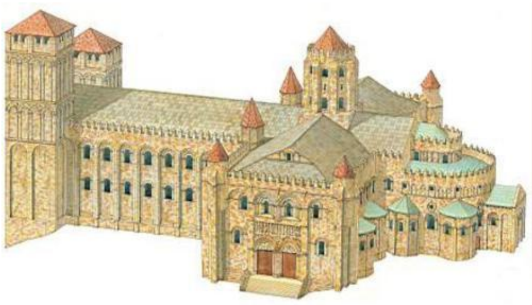
Reconstrución hipotética da catedral románica de Santiago de Compostela

Este traballo consiste en sintetizar a historia da construción desta catedral, pero unicamente a obra do románico, pois durante os anos finais do século XVII e comezos do XVIII engadíronse numerosos elementos (Torre do reloxo, fachada do Obradoiro, peche do Pórtico Real...) que son os que hoxe dan o aspecto exterior a esta catedral. Por iso este traballo debe centrarse, basicamente, no seu interior, que é o que corresponde á época do románico.