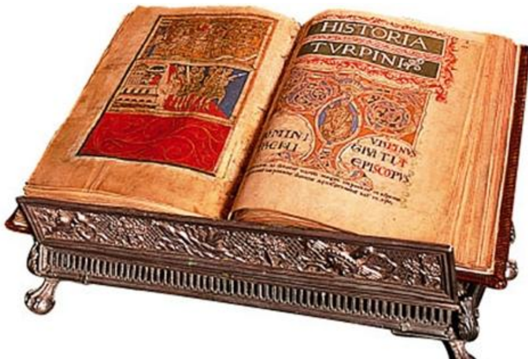
Códice Calixtino (Catedral de Santiago)